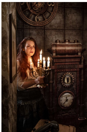
Diese Bilder sind beim Testshooting entstanden.

Wir werden bei unserem Fotoevent das viktorianische Zeitalter des Steampunks streifen und einzigartige Fotos machen dürfen. Steampunk fällt in den Bereich des sogenannten Retro-Futurismus, also einer Vorstellung der Zukunft aus der Perspektive früherer Zeiten (Textauszüge von Wikipedia).