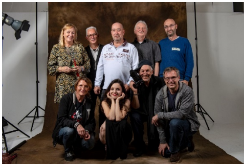
Gruppenbild von links oben: